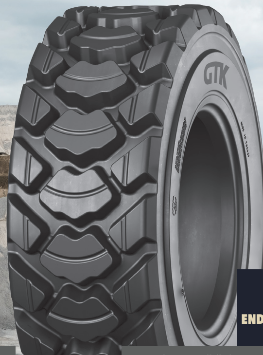
BC80 ENDÜSTRİYEL HAFRİYAT LASTİKLERİ