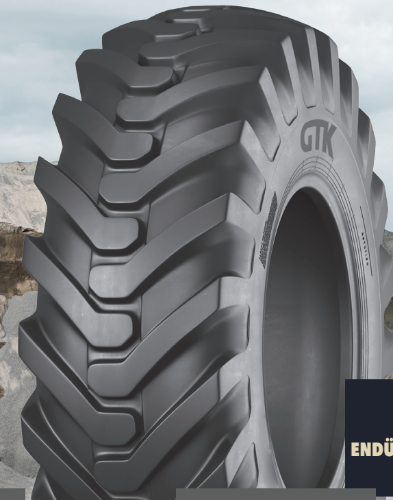
LD90 ENDÜSTRİYEL HAFRİYAT LASTİKLERİ