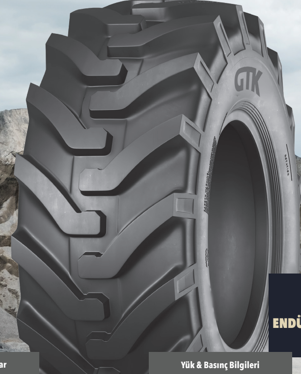
LD96 ENDÜSTRİYEL HAFRİYAT LASTİKLERİ