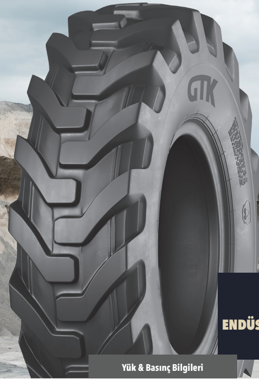
GD90 ENDÜSTRİYEL HAFRİYAT LASTİKLERİ