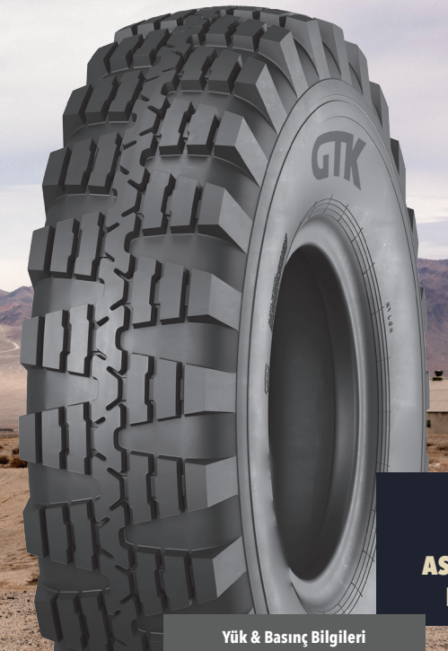
OC20 ASKERİ PANZER LASTİKLERİ