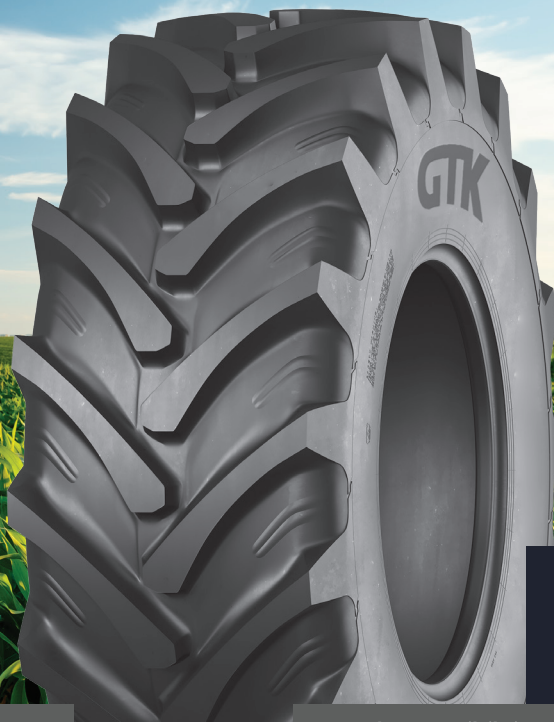
RS220 RADYAL TRAKTÖR LASTİKLERİ