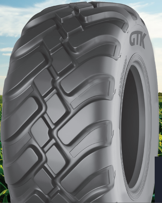
RF40 RADYAL RÖMORK LASTİKLERİ