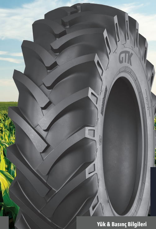
AS100 TRAKTÖR ARKA LASTİKLERİ