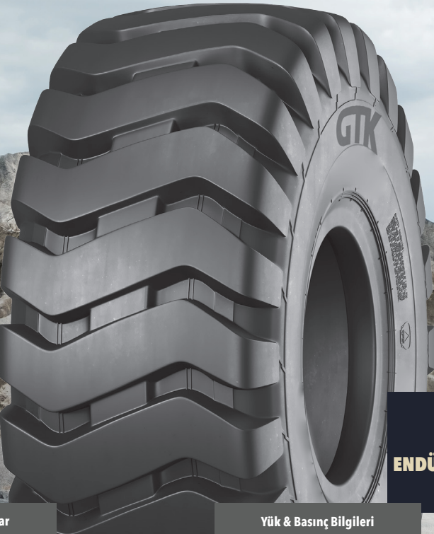
HP100 ENDÜSTRİYEL HAFRİYAT LASTİKLERİ