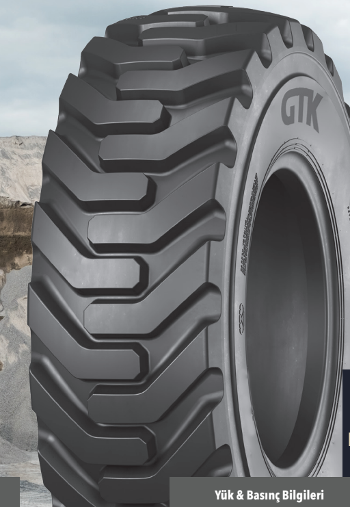
LD92 ENDÜSTRİYEL HAFRİYAT LASTİKLERİ