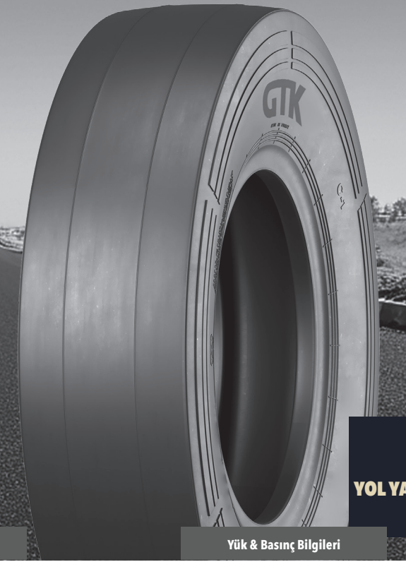
SM40 YOL YAPIM MAKİNELERİ LASTİKLERİ