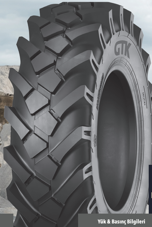
OC10 ENDÜSTRİYEL HAFRİYAT LASTİKLERİ