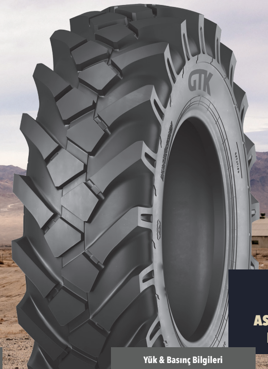
OC10 ASKERİ PANZER LASTİKLERİ