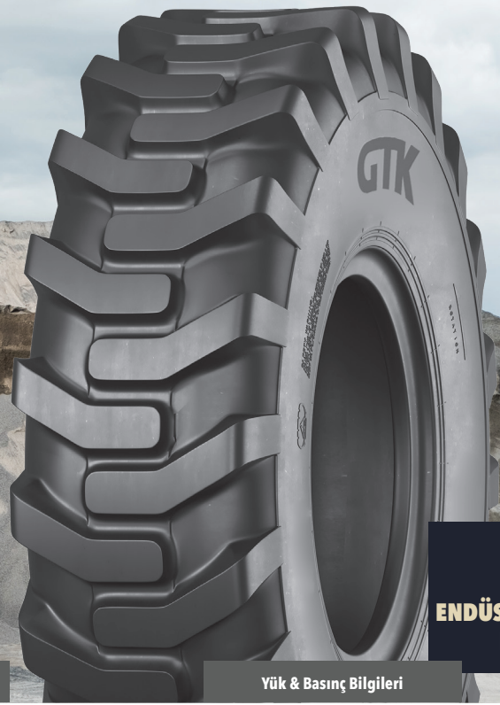
GD92 ENDÜSTRİYEL HAFRİYAT LASTİKLERİ