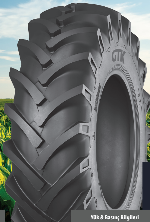
AS100 TRAKTÖR ARKA LASTİKLERİ