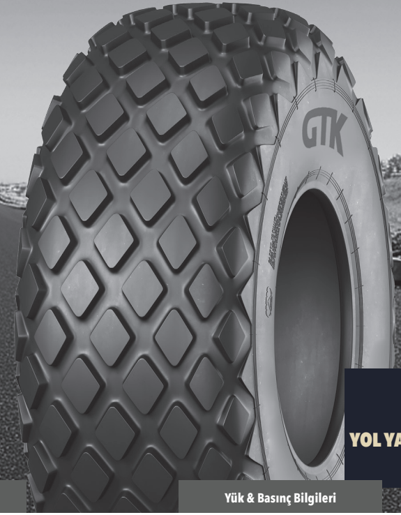
GD94 YOL YAPIM MAKİNELERİ LASTİKLERİ